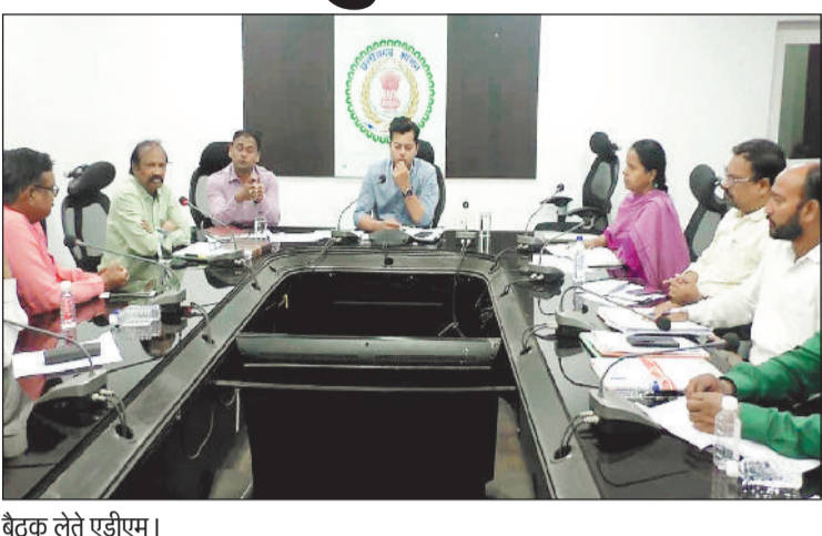
बैठक लेते एडीएम।

हरिभूमि न्यूज ►► रायगढ़ खाद्य विभाग की विस्तृत समीक्षा बैठक ली गई। जिले में संचालित खाद्यान्न भंडारण एवं वितरण कार्यों की प्रगति की समीक्षा की। अपर कलेक्टर ने कहा कि जिले की सभी 665 उचित मूल्य दुकानों में आगामी तीन माह का खाद्यान्न एकमुश्त भंडारित कर उसका सुचारु वितरण सुनिश्चित किया जाए, ताकि हितग्राहियों को किसी प्रकार की असुविधा न हो। उन्होंने कहा कि अप्रैल माह के भंडारण कार्य को शीघ्र पूर्ण करते हुए सभी उचित मूल्य दुकानों में चावल उत्सव आयोजित किया जाए और हितग्राहियों को समय पर खाद्यान्न उपलब्ध कराया जाए। साथ ही शेष दो माह के भंडारण कार्य को 15 अप्रैल तक पूरा करने के निर्देश दिए। अपर कलेक्टर ने सभी गोदामों में भंडारण एवं